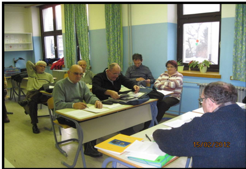
Slika 1: Na občnem zboru v prvi klopi desno.

Bil je tudi ustanovni član Društva upokojencev Bitnje – Stražišče. Tudi tu se je z veliko vnemo lotil dela pri ustanavljanju in zagonu dela v novem društvu.