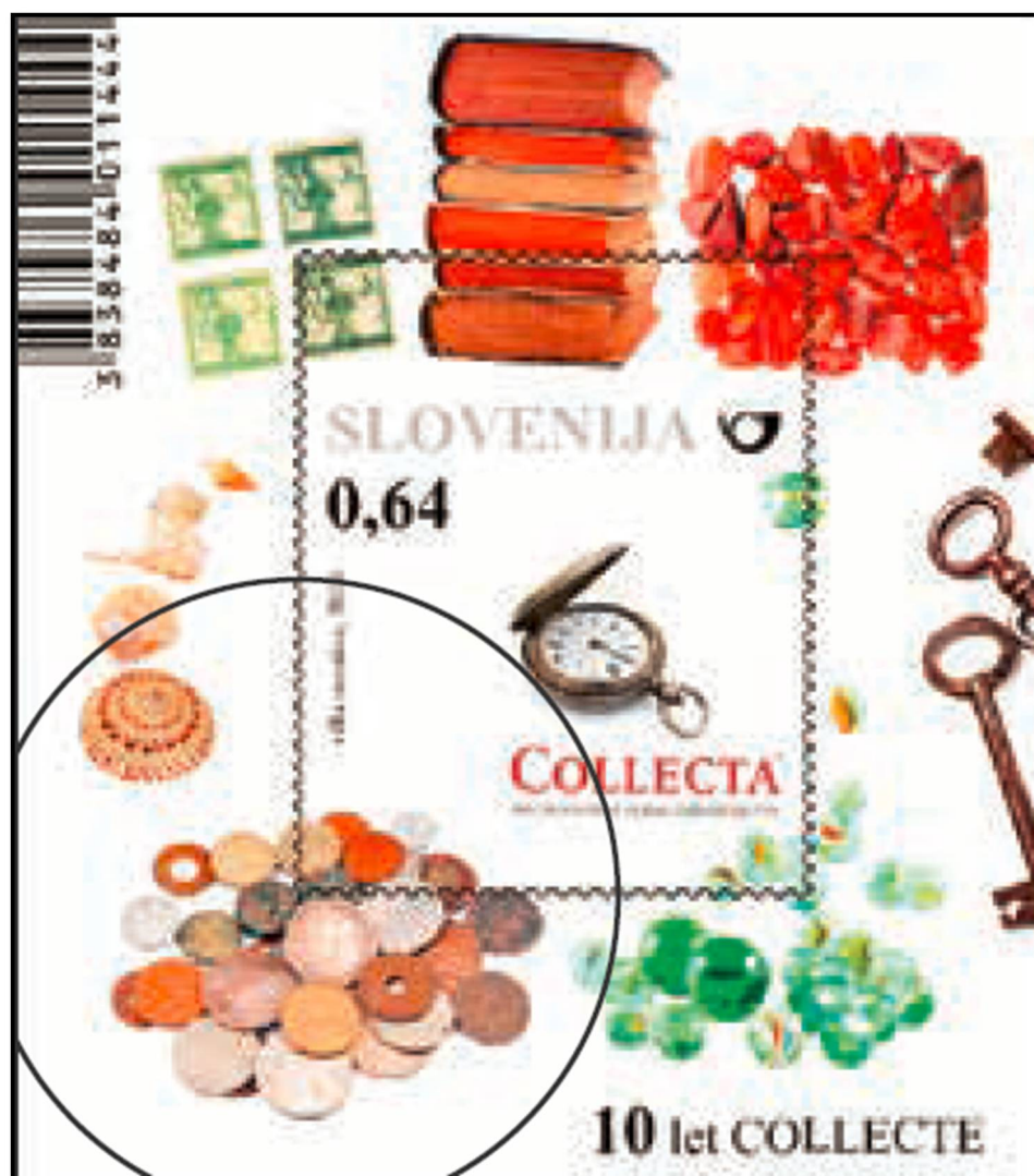
Slika 2: Bodoča znamka Pošte Slovenije simbolizira teme zbirateljstva in boj zbirateljev s časom

Z izidom, poštних znamk se je začela doba zbiranja znamk, v 175 letih je bilo izdanih že toliko znamk, da je treba vedeti kaj zbirati. Filatelija je